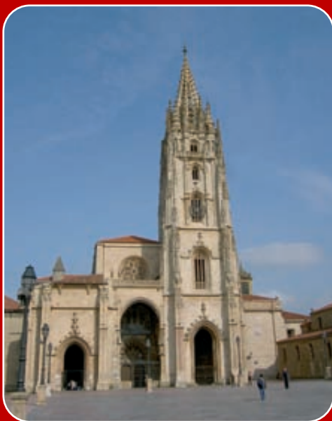
Catedral de Oviedo