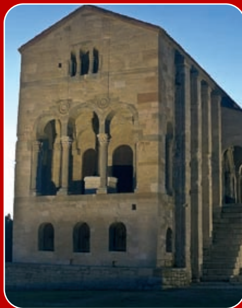
Santa María del Naranco

ENTREGA DE LOS PREMIOS LABORAL 2000 - BANESTO A LA CALIDAD Y EXCELENCIA PROFESIONAL Y EMPRESARIAL EN MATERIA SOCIO-LABORAL, DERECHO DE TRABAJO Y SEGURIDAD SOCIAL EN SU IX EDICIÓN Y CORRESPONDIENTES AL AÑO 2010