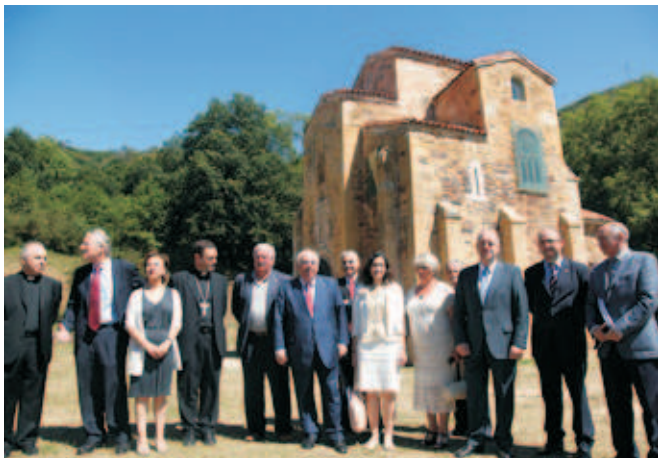
Visita institucional a los Monumentos Prerrománicos.

El Gobierno asturiano, que ha invertido en los últimos 11 años cerca de 3,8 millones de euros en el Prerrománico y su entorno, asume en este Convenio el compromiso de impulsar la investigación, restauración y promoción de estos monumentos, para lo que invertirá 560.000 euros, mientras el Ministerio aporta 390.000 euros e Iglesia y Ayuntamientos asumen de mejora de los respectivos entornos. La firma de este Convenio, que significa un impulso promocional cultural y turístico sin precedentes, se produce además en un año cargado de simbolismo dado que se conmemoran los 25 años de la inclusión de los principales Monumentos Prerrománicos en el listado de Patrimonio Mundial de la UNESCO, con el consabido efecto mediático que esta efeméride conlleva.