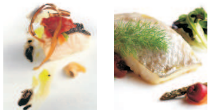
Nuestra gastronomía es muy valorada por los turistas.

El estudio arroja datos interesantes del perfil del turista gastronómico, entre cuyos rasgos destacan que viaja en coche, pasa una semana en la región y gasta alrededor de unos mil euros. Otro de los datos que fueron subrayados por José Luis Vega es que se pueden distinguir hasta cinco grupos de visitantes "gourmet" que se corresponderían con la procedencia de los principales turistas gastronómicos de Asturias: Galicia, País Vasco, Castilla-León, Madrid y Cataluña. El Plan de Competitividad Gastronómico, en cuyo marco se desarrolló el estudio, se concretará a finales de año y se centrará en estas comunidades como destinos de promoción prioritarios.