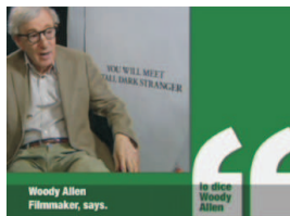
Fotograma del spot.

Coincidiendo con la celebración del Día de Asturias en la EXPO de Shanghai el Gobierno del Principado de Asturias presentó la nueva imagen de promoción en el mundo, que está apoyada en los testimonios de grandes figuras internacionales relacionados con las artes, la comunicación, la ciencia, el deporte, la economía y la empresa bajo el lema “Asturias, lo dice todo el mundo”.