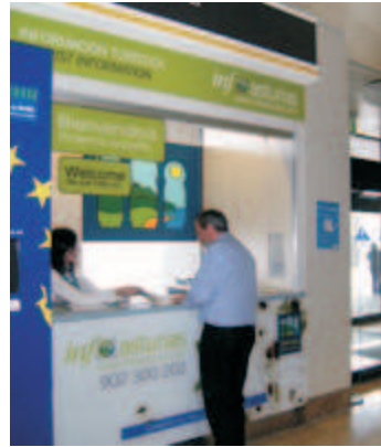
Oficina de Turismo en el Aeropuerto.

El primer semestre del año en el aeropuerto de Santiago del Monte se ha iniciado con un repunte en el aumento de pasajeros y que se ha reflejado en el incremento de consultas en la renovada Oficina de Información Turística del aeropuerto.