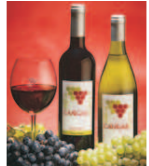
Vino de la Tierra de Cangas.

Completando la oferta vinícola de la villa, el equipamiento acoge en su interior una completa exposición museográfica que aúna tradición y vanguardia para explicar el pasado y el futuro del mundo del vino y su proceso de elaboración.