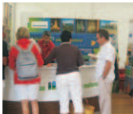
Edición del año 2009.

Es un festival único de las tradiciones milenarias de esta cultura que se ha convertido en todo un referente y una cita ineludible para los amantes de la cultura celta. Más de 700.000 espectadores son partícipes de este gran encuentro intercéltico. Cada año, la región de Bretaña recibe a más de 4.500 músicos, cantantes y bailarines llegados desde Escocia, Irlanda, Gales, Asturias, Canadá y Australia. Nuestra Comunidad acudirá a este evento considerado como uno de los más importantes de su género en Europa, con un punto de Información Turística y elementos promocionales donde se representará la variada oferta turística del Principado de Asturias. En la edición anterior se atendieron un total de 1.800 consultas.